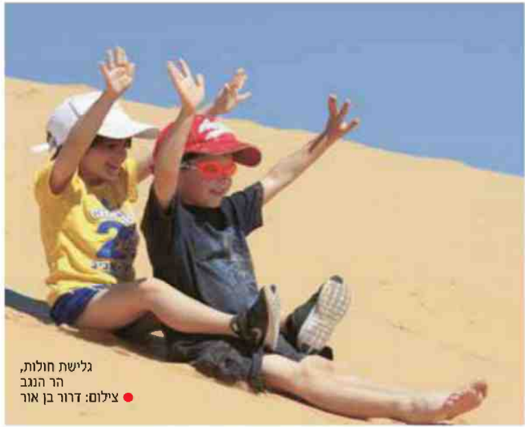
גלישת חולות, הר הנגב