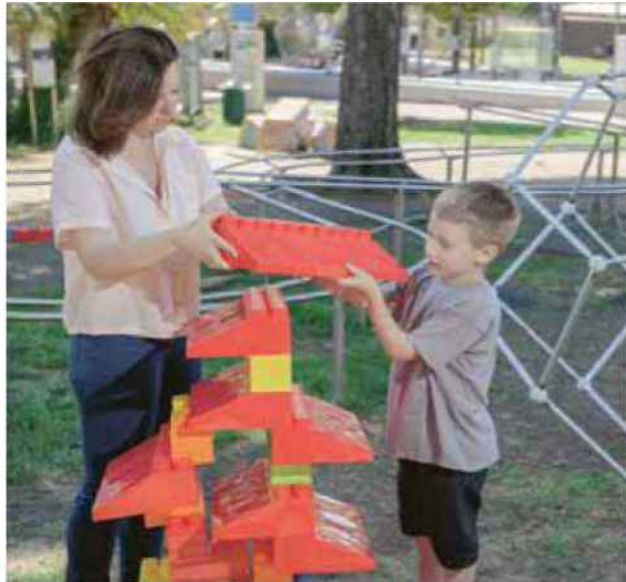
גן המדע, מכון ויצמן