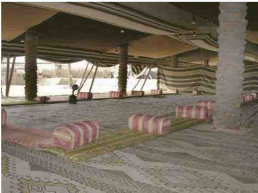
מאהל בדואי, חאן השיירות

המיוחדות, ההורים מוזמנים למסע בעקבות חייו וסרטיו של הבמאי והיוצר מנחם גולן, שהלך לעולמו בקיץ שעבר, בגיל 85. ניתן ליהנות ממיזמים אמנותיים בהשתתפות יהורם גאון, גילה אלמגור וצחי נוי ולהציץ בפריטים נדירים מסרטיו של גולן, ביניהם החרבות המיתולוגיות מהסרט "נינג'ה אמריקאי", האופנוע עליו רכב צ'אק נוריס בסרט "מחץ הדלתא" ועוד. מוזיאון האדם והחי, רמת גן, טל': 03*6315010