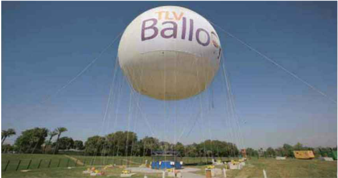
TLV Balloon, גני יהושע, תל אביב

חצי וקצת מהחופש הגדול מאחורינו, אבל החלק המשמעותי יותר לפנינו. רוב הקייטנות הסתיימו, הסבים והסבתות משוועים לקפיצה קטנה לחו"ל והמשפט "אמא, משעמם לי" כבר עומד לילדים שלכם על קצה הלשון. אז מה עושים? יוצאים מהבית. קבלו כמה הצעות לאטרקציות ברחבי הארץ < ורד לרנר < veredl@omer-media.co.il